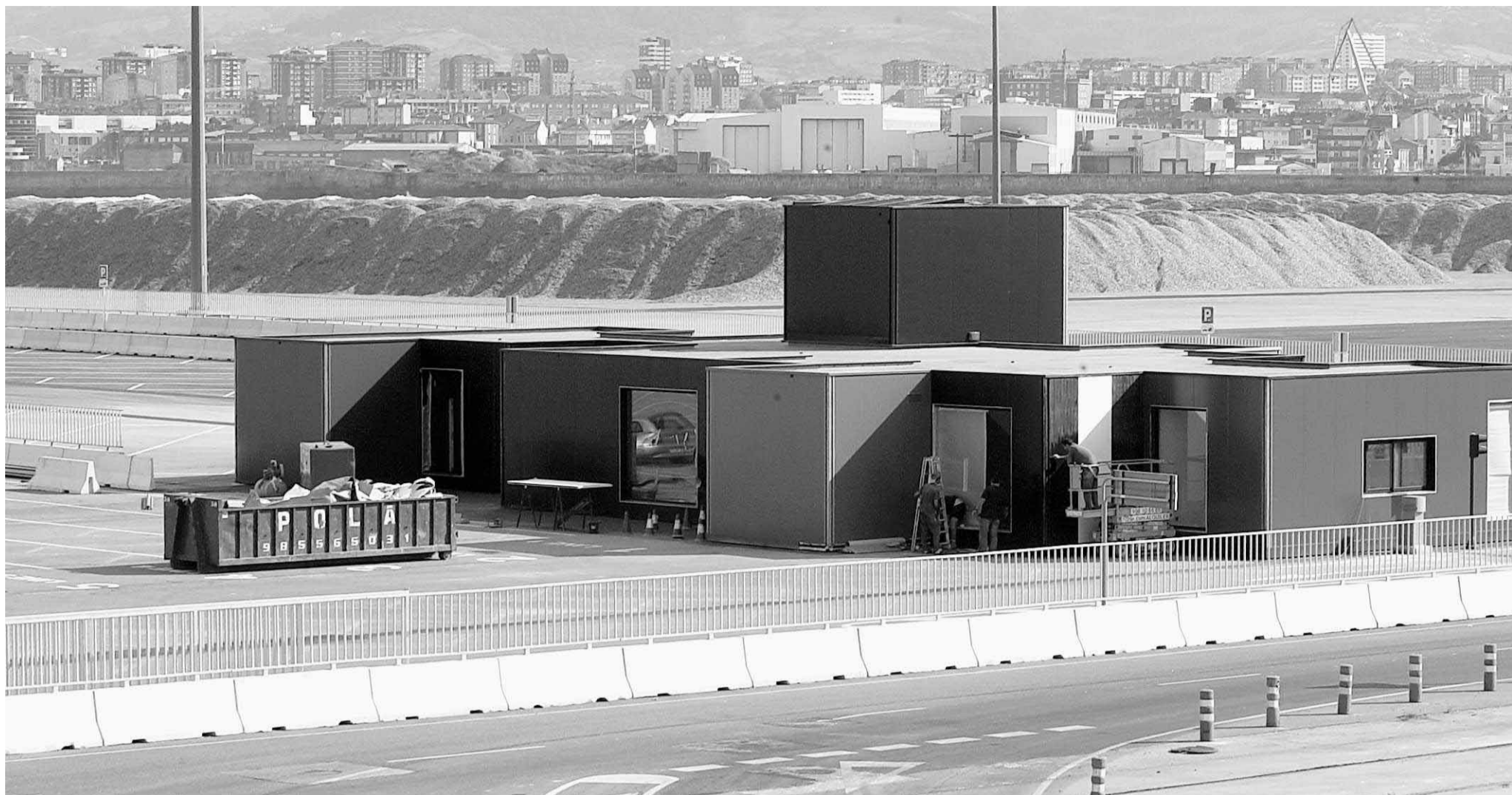
Vista general del edificio modular que servirá de terminal para la autopista del mar que unirá a partir del próximo día 8 los puertos de Nantes-Saint Nazaire y El Musel.