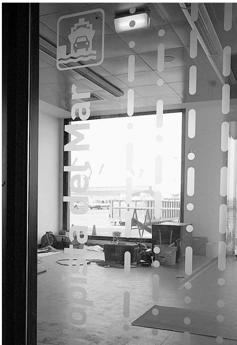
Interior, ayer aún sin equipar, de la terminal.

La nueva terminal de la autopista del mar de El Musel deberá tener gestores, provisionales o definitivos, el próximo día 9, fecha en la que, en torno a las once de la mañana, llegará el primer barco procedente de Nantes. De momento, se sabe que 15 vehículos y una cantidad no determinada de camiones o remolques necesitarán esos servicios, porque ya han efectuado reservas.