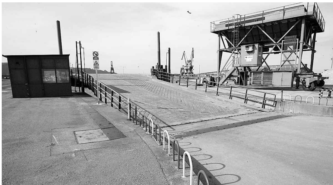
Rampa ro-ro de los muelles de La Osa, donde atracará el 'Norman Bridge'.