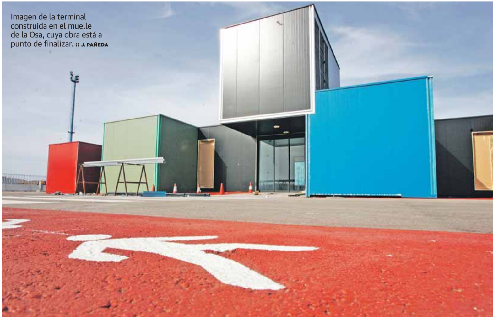
Imagen de la terminal construida en el muelle de la Osa, cuya obra está a punto de finalizar.

El Musel se prepara para la autopista del mar